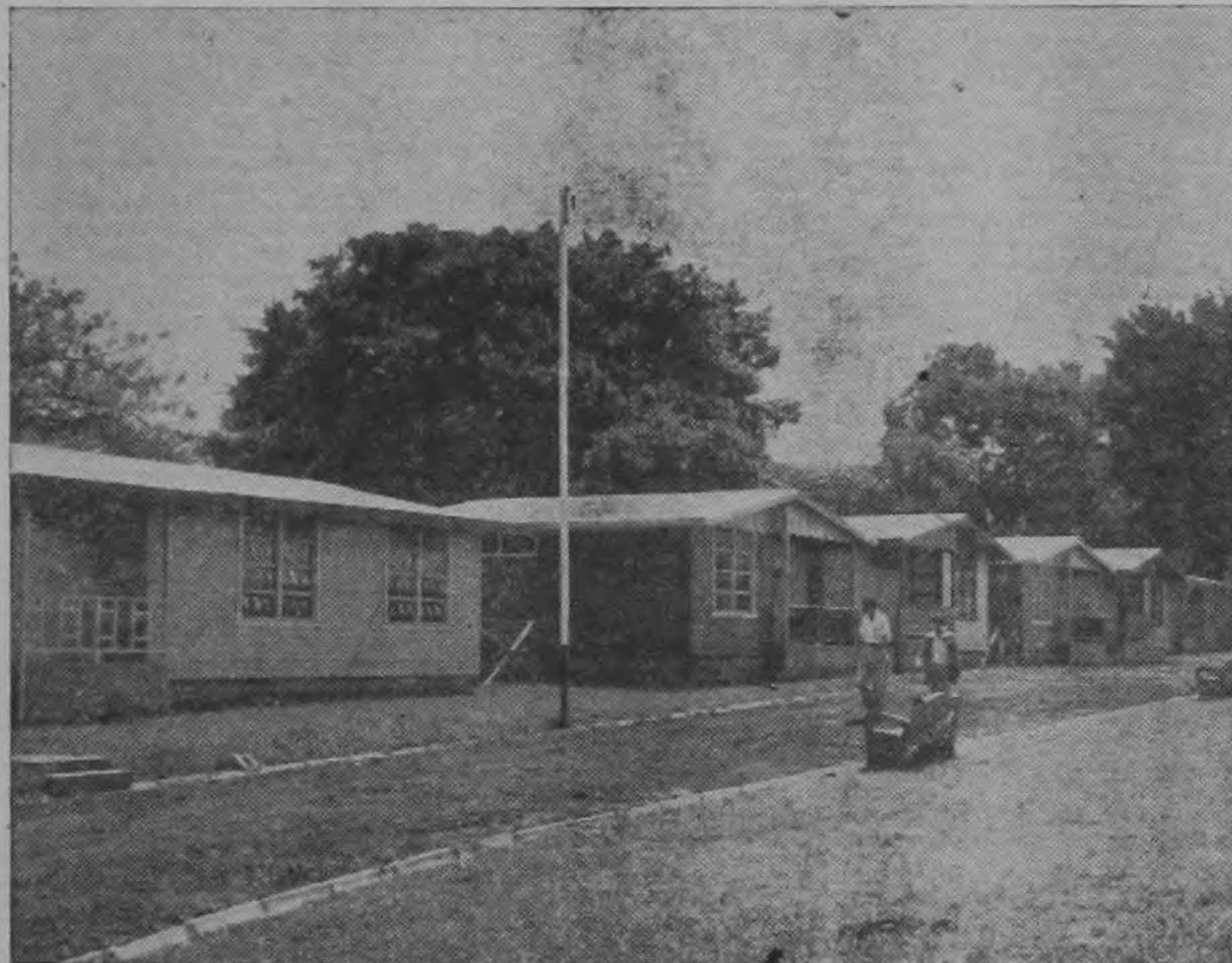
Conjunto Residencial de 15 viviendas, Barba. Colaboró con terreno la Municipalidad. Obras Públicas en el arreglo de calles. Las Compañías Eléctricas en las instalaciones eléctricas. Se entregará el domingo 30 a los 11:30 a.m.

ciudad del Benemérito Licenciado Cleto González Víquez. Las viviendas se encuentran precisamente a corta distancia del lugar donde naciera el ilustre costarricense. La corporación municipal barbeña contribuyó en forma muy apreciable mediante la donación de los terrenos a la construcción de este conjunto residencial, con el que se aliviará el problema de la vivienda.