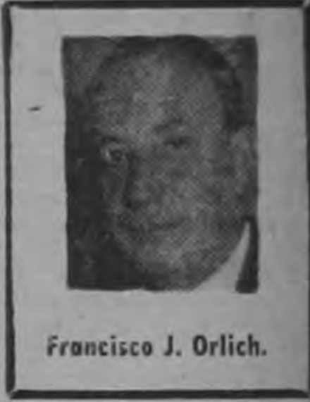
Francisco J. Orlich.